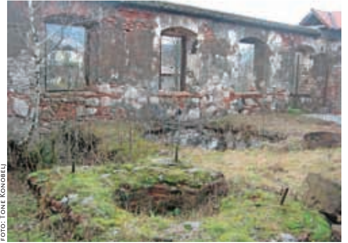
Prostor z luknjami, kjer je nekoč stal znameniti Ruardov plavž.