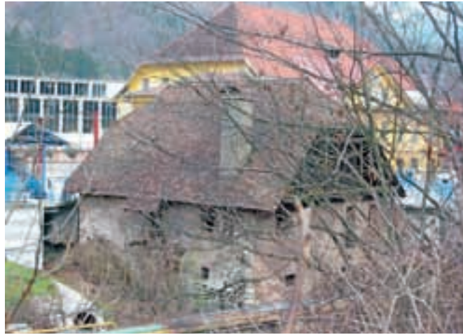
Zapuščen mlin na Stari Savi iz Podmežakle / FOTO: TONE KONOBELJ