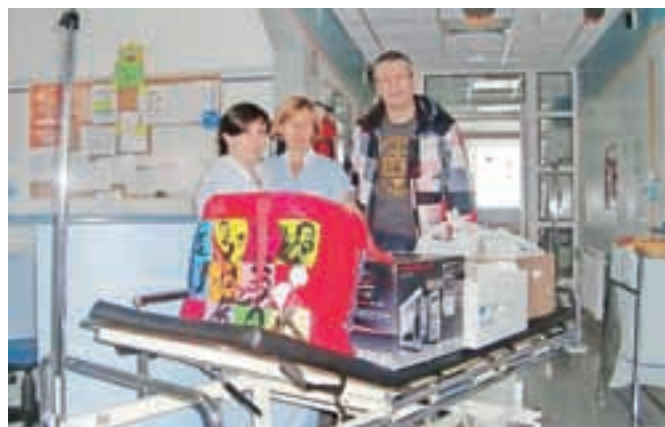
Člani zveze društev prijateljev mladine so ob dnevu bolnikov obdarovali otroke v jeseniški bolnišnici.